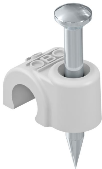
ISO-nagelclip, kort model